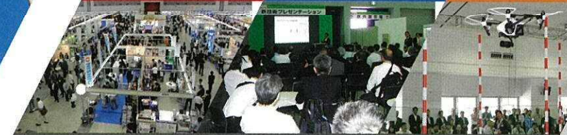
継続学習制度(CPDS)認定プログラム【(一社)全国土木施工管理技士会認定】