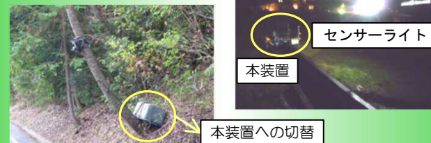
不法投棄の監視カメラ・照明の電源としての利用のイメージ