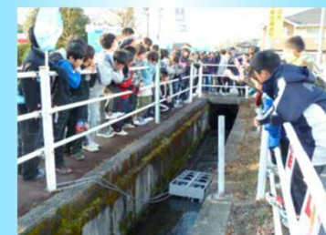
環境学習のツールとしての利用イメージ