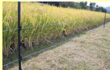
害獣対策用の電柵のイメージ 資料：タイガー株式会社「アニマルキラー」