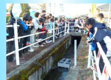
環境学習のツールとしての利用イメージ