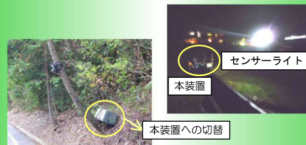
不法投棄の監視カメラ・照明の電源としての利用のイメージ

《災害時等の非常用電源としての利用》 災害時等に電力会社からの電力供給が途絶えた場合においても電力を得ることができます