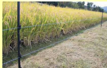
害獣対策用の電柵のイメージ 資料：タイガー株式会社「アニマルキラー」

《害獣対策用電源としての利用》 田畑における獣対策用の電柵の電源として利用することができます