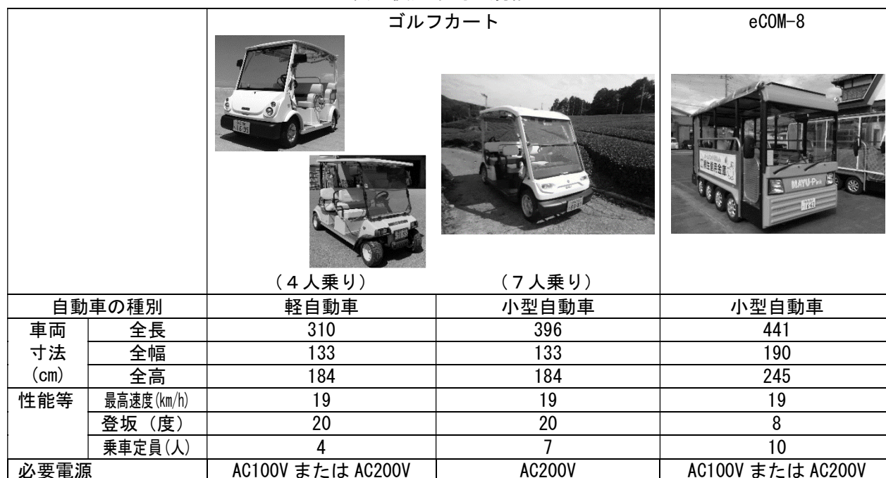
表 使用車両の規格

※カートの車両寸法については、手配する車両のメーカー及び車種等によって若干変動する可能性がある。