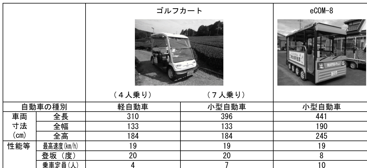
表 使用車両の規格

※カートの車両寸法については、手配する車両のメーカー及び車種等によって若干変動する可能性がある