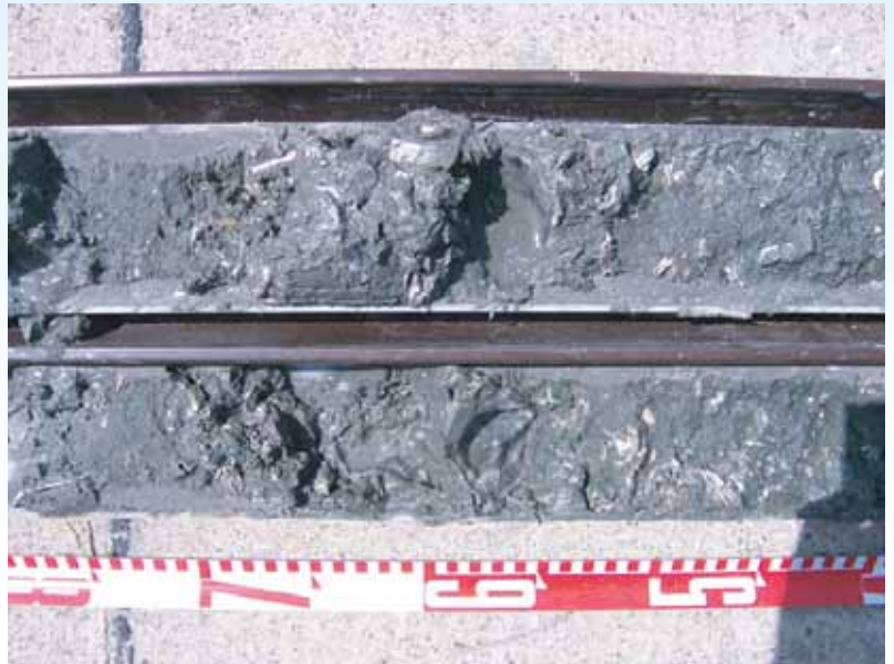
採取試料状況（カキ殻混じりの粘土）