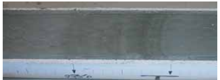
採取試料の処理・観察状況